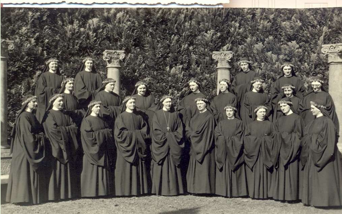
Ewige Profess 21. März 1933